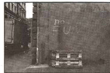
No Fun (Leipzig 1988)