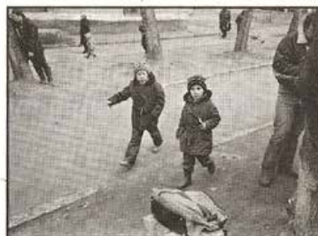
Straßenszene, Permer Gebiet (SU), SW-Fotografie, 18x24 cm, 1988