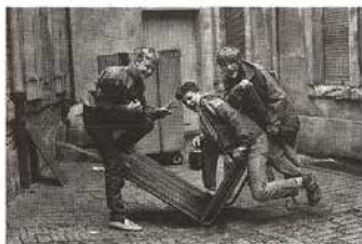
Hinterhof am Schillerplatz (Dresden 1989)